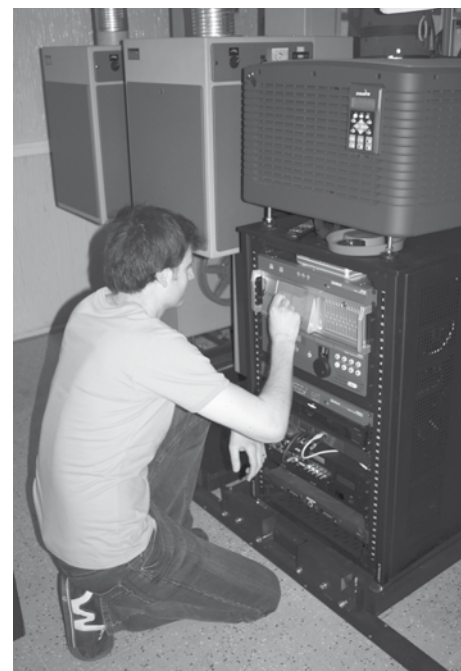
Promítač při obsluze digitálního zařízení umožňující promítání ve 2D a 3D.

Snad jen to, že zvuk v našem kině a digitální technologie 2D a obzvláště potom 3D se nedá jen tak