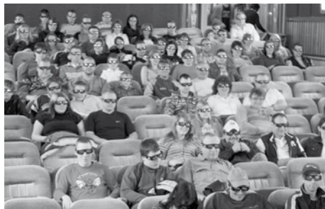
Pohled do sálu při promítání filmu Soubor titánů 3D

Během posledních dvou let byla v milevském kině Bios eM provedena modernizace promítání. Za pomoci finanční podpory Státního fondu České republiky pro podporu a rozvoj české kinematografie se podařilo v roce 2008 v kině realizovat projekt s názvem Modernizace promítání, obraz i zvuk –