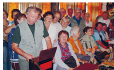
Účastníci minulých ročníků Univerzity třetího věku při návštěvě Muzea hracích strojů.

V lednovém čísle Milevského zpravodaje jsme čtenáře informovali o tom, že Univerzita třetího věku pokračuje i v roce 2013. První schůzka se uskutečnila ve středu 9. 1. 2013. Pokud se někdo nemohl zúčastnit a chtěl by přednáška a exkurze navštívit, může se přijít zapsat ještě ve středu 6. 2. 2013 . Přednáška Kraj Vysočina – přírodní podmínky se uskuteční od 18.00 hod. v loutkovém sále Domu kultury v Milevsku.