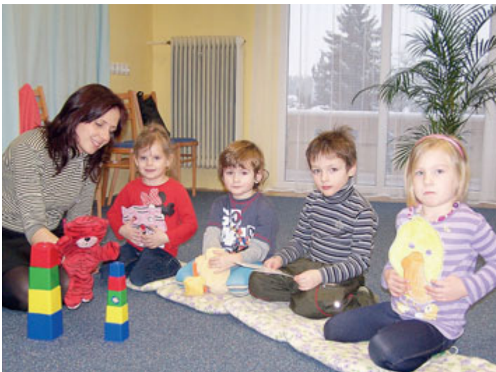
English with Cookie – angličtina pro nejmenší od 3 do 7 let probíhá každou středu v DK Milevsko.