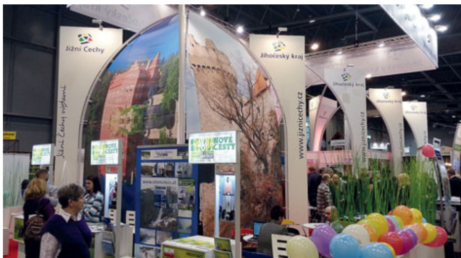
Celkový pohled na krajskou prezentaci.

Mezinárodní veletrh turistických možností v regionech REGIONTOUR se koná každoročně ve druhé polovině ledna na brněnském výstavišti. Jedná se o největší prezentaci průmyslu cestovního ruchu s akcentem na regiony ve střední Evropě. Město Milevsko se zde v letošním roce prezentovalo společně se Svazkem obcí Milevska v informačním stánku v rámci expozice Jihočeského kraje. Byly zde představeny nové brožury „Milevský klášter“ a „Milevské maškary“, které vydala obecně prospěšná společnost Milevský kraj v loňském roce. Dále zde byly poskytovány informace o turistických možnostech v našem regionu. Největší zájem návštěvníků byl právě o informace o maškarach a klášteře. Turistické atraktivity jižních Čech v jihočeské expozici nabízely ve dnech 17.–20. 1. 2013 téměř dvě desítky vystavovatelů – mimo Milevska také např. Jihočeská centrála cestovního ruchu, Nadace Jiho-