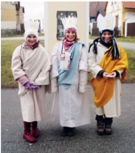
Koledníci v Sepekově