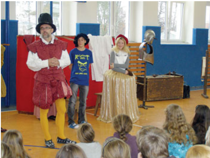
Ve čtvrtek 19. prosince se žáci 1. ZŠ Milevsko seznámili s dobou Rudolfa II. S didakticko-divadelním představením za nimi přijela společnost Faber, která jim představila zvyky a způsob života v dané době.