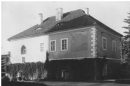
Latinská škola - foto (40. léta 20. století)