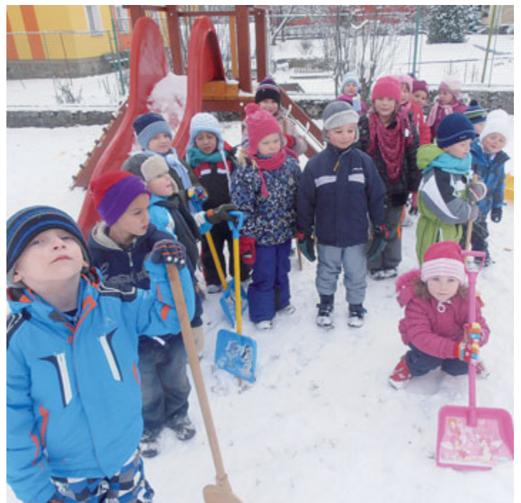
Děti z mateřské školy Kytička si na školní zahradě užívají sněhové nadílky.