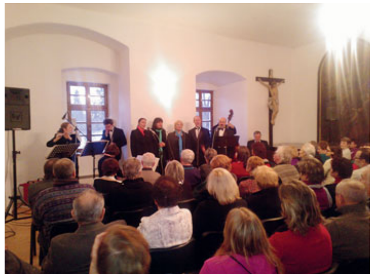
Seďmým koncertem na závěr Vánoc bylo vystoupení skupiny Linha Singers v Latinské škole, které se uskutečnilo v neděli 13. ledna.