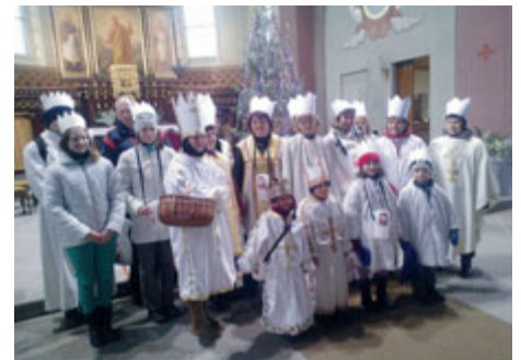
Žehnání koledníkům před sv. Bartolomějem v pondělí 2. ledna.

procent na projekty Diecézní charity v Č. Budějovicích, pět procent na režii sbírky a posledních pět procent na projekty pomoci organizované sekretariátem Charity ČR. Celá Tříkrálová sbírka je krásnou tečkou za obdobím Vánoc a je možností, jak vykonat dobrý skutek. Doprovodnou akcí bylo 2. ledna požehnání koledníkům a posvěcení křídly, bude vybírána nejhezčí fotografie z koledování a připravíme i následné setkání koledníků s malým občerstvením, jako poděkování za pomoc a obětavost.