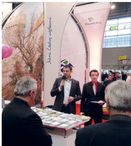
Hejtman Jihočeského kraje Jiří Zimola 17. ledna slavnostně odstartoval krajskou prezentaci.