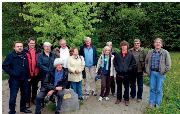
Setkání u stromu darovaného při jedné z předchozích návštěv.

Naši přátelé také projevili přání předat místní organizaci ČSSD nebo lépe městu dar, ale takový, který bude mít trvalejší a širší hodnotu, tak jak tomu bylo například s lípou, která byla při předminulé návštěvě vysazena v parku nad Suchanovým rybníkem. Po jistém přemýšlení se nakonec řešení našlo. V milevském muzeu se v rekonstruované budově na dru-