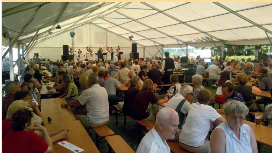
1. ročník si nenechalo ujít cca 500 návštěvníků.