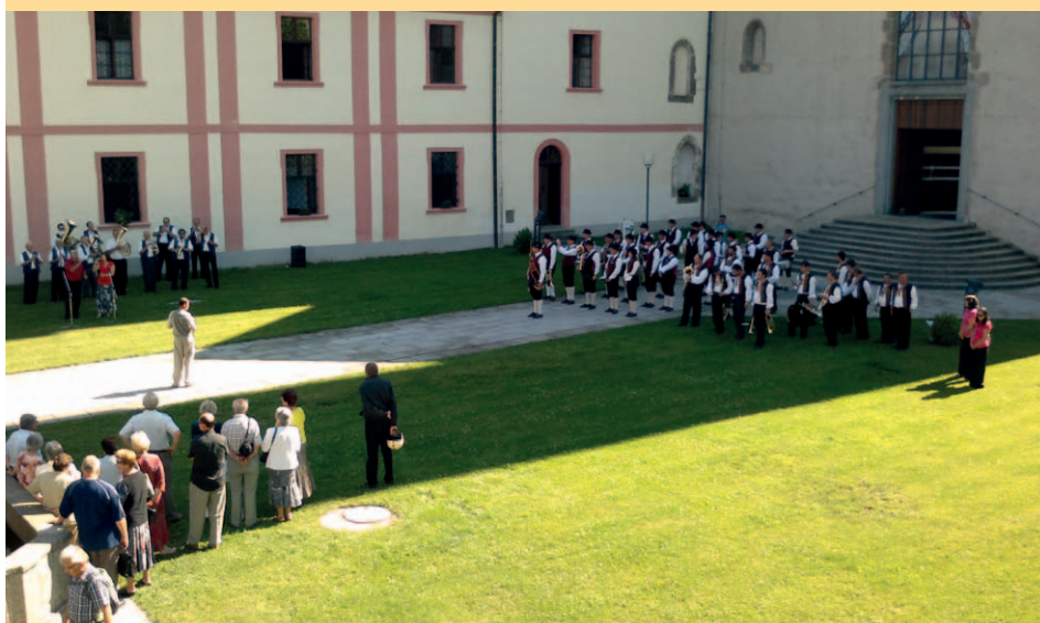
V loňském roce rozezněly dechové kapely i nádvoří milevského kláštera.

Spolufinancováno Evropskou unií z Evropského fondu pro regionální rozvoj Gemeinsam mehr erreichen / Společně dosáhneme více