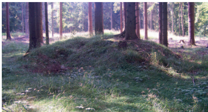
Údraž. Jedna z mohyl na pohřebišti v lesní poloze Palčice.

Příchod slovanského etnika na naše české území spadá do druhé poloviny 6. století. Jižní Čechy však byly zpočátku po odchodu germánského obyvatelstva někdy v první polovině 6. století dle dosavadních znalostí pravděpodobně neobydlené nebo pouze minimálně. První Slované do našeho jihočeského kraje přišli až v průběhu 7. století, kdy se začínají objevovat sporadické nálezy. K největšímu rozkvětu raně středověkého osídlení ovšem dochází až o století později. To se zvláště v jihočeské krajině projevuje přítomností památek, do dnešní doby ukrytých v našich lesích. Jedná se o opevněná sídla slovanské elity nazývaná hradiště a mohylová pohřebiště skládající se z jednotlivých objektů – mohyl – vzniklých přibližně od poloviny 8. století.