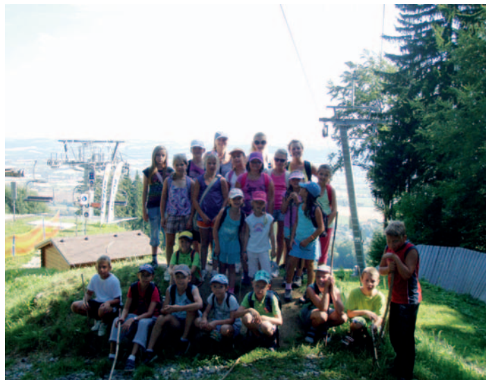
Centrum Milísek od 4. do 10. srpna pořádalo již 3. ročník DT Monínek 2013 ve sportovním areálu Monínek, který byl opět plný nových dětských zážitků.