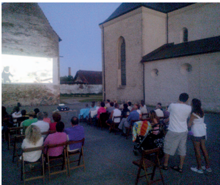
Snímkem se vracíme k letnímu promítání na druhém nádvoří kláštera. Akce probíhala 2. až 4. srpna pod záštitou města.