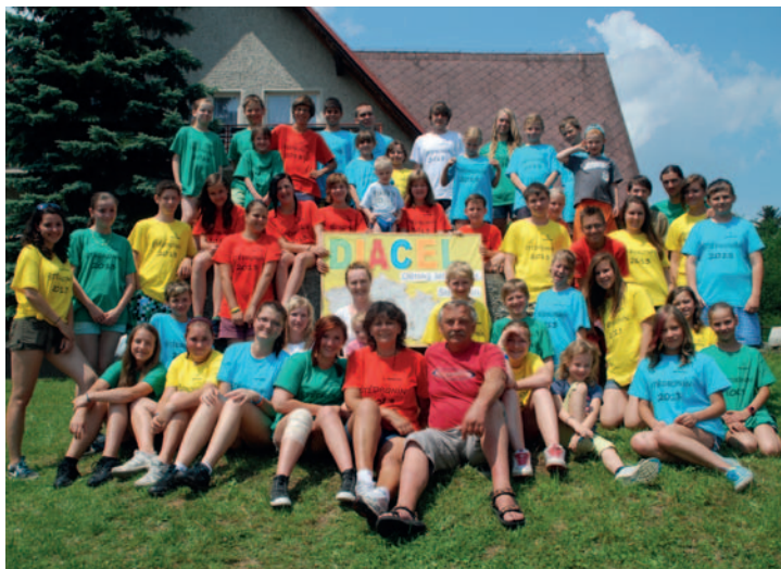
O letních prázdninách se již tradičně pro děti z celé ČR uskutečnil Dia tábor na Štědróníně. Na fotografii jsou společně všechny děti, instruktoři v tričkách v barvách týmů a zdravotníci.