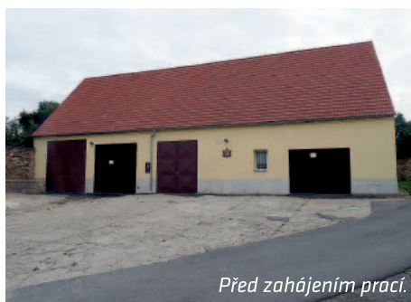
Před zahájením prací.