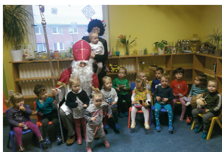
Za dětmi do jesliček Milísek přišel dopoledne 3. a 4. prosince Mikuláš s čertíkem. Děti Mikuláše a čertíka přivítaly společnou básničkou, za kterou dostaly sladkosti. Děti byly tak šikovné, že si na konec společně všichni zacvičili.