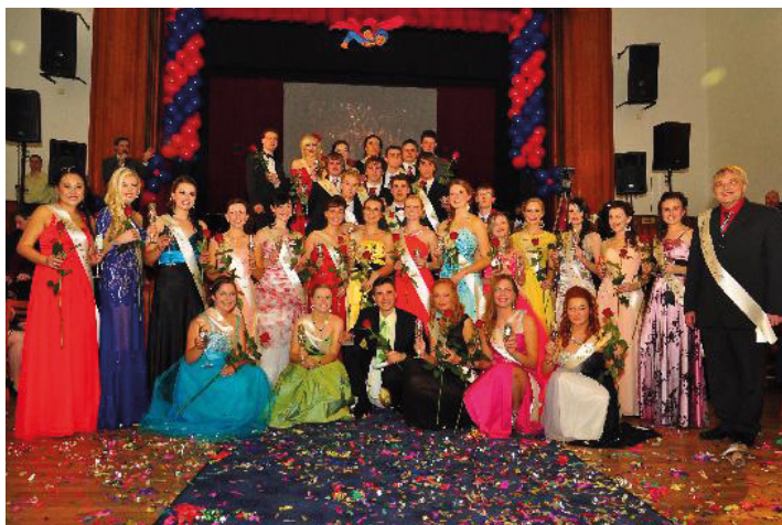
V pátek 12. prosince byli v milevském domě kultury do stavu maturantského povýšení studenti 4. A a Oktávy Gymnázia Milevsko.