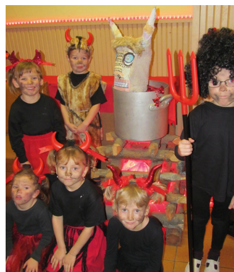
V sobotu 6. prosince děti z Mateřské školy Kostelec nad Vltavou potěšily svým čertovským vystoupením plný sál dětí, obyvatel Jickovic i okolních vesnic v místním pohostinství Pod kaštanem.