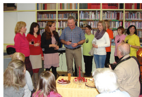
Zástupci městská knihovny ve středu 10. prosince slavnostně otevřeli svoji nově zrekonstruovanou pobočku v milevském domě kultury. K dobré náladě přispěli i klienti z Domova pro osoby se zdravotním postižením ve Zběšičkách, kteří také svými výtvarnými pracemi přispěli k vyzdobě prostor knihovny.