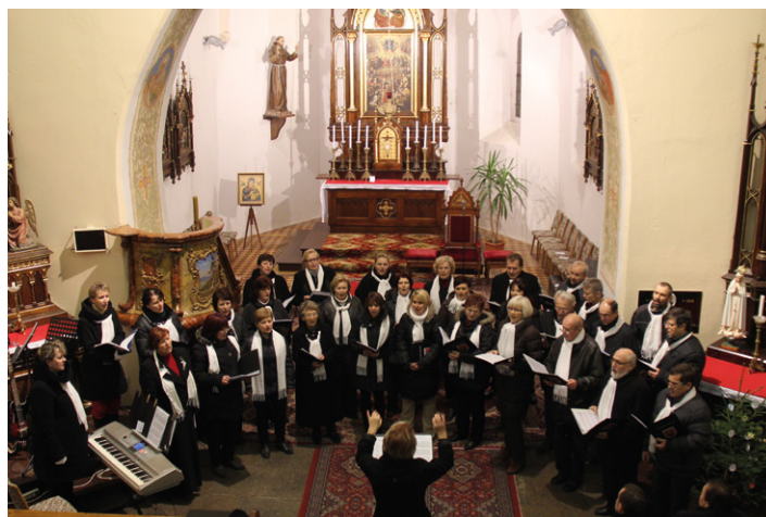
Dne 14. 12. 2014 si Milevský smíšený sbor poprvé zazpíval ve farním kostele Všech Svatých v Kovářově. Zcela zaplněnému kostelu představil svůj adventní repertoár.