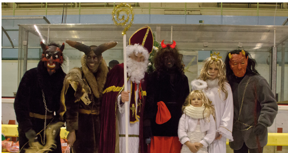
Dne 4. 12. 2014 společnost SPOS Milevsko s.r.o. uspořádala již po jedenácté Mikulášskou nadílku na ledě, které se zúčastnilo cca 70 masek. Pro děti byla připravena za pomoci sponzorských darů nadílka.