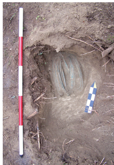
Depot u Kučeře při archeologickém výzkumu.

Polotovary žeber byly transportovány z oblasti východních Alp podél větších vodních toků. Proto se většina nálezů nachází v různé vzdálenosti od řeky Vltavy, která zcela jistě byla v té době komunikační trasou pro tehdejší obchodníky. Otázkou zůstává místo jejich finálního řemeslného zpracování na movité artefakty (sekery, šperky, jehlice atd.) doby bronzové.