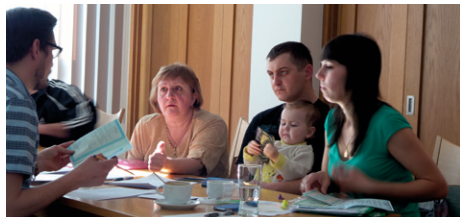
Na fotografii krajanská rodina při sociálním setření.

Téměř stovka krajanů z Ukrajiny, kteří se rozhodli kvůli obavám z bezpečnostní situace opustit zemi, dorazila do České republiky. Program přesídlení koordinuje Ministerstvo vnitra, které pověřilo Charitu Česká republika, konkrétně Arcidiecézní charitu Praha, realizací asistence při přesídlení a integraci.