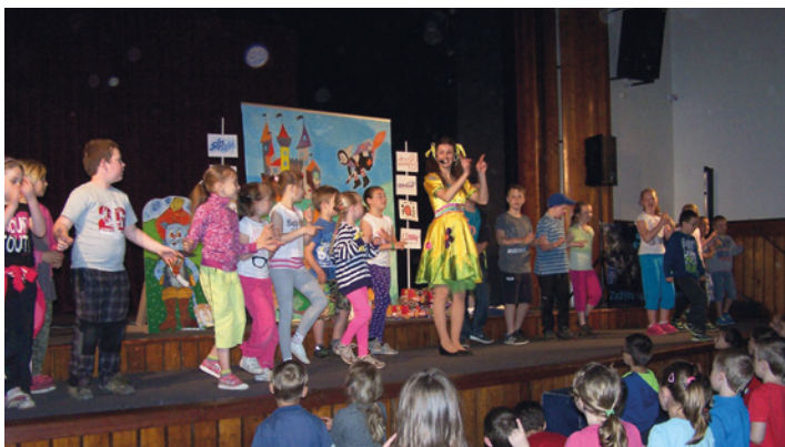
Dům dětí a mládeže ve spolupráci s domem kultury připravil pro žáky prvního stupně milevských základních škol představení a soutěže ke dni dětí.