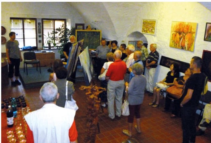
Foto zachycuje vernisáž výstavy obrazů, šperků, keramiky a patchworku s názvem P.U.B. MILÝM MILEVSKÝM, která se uskutečnila ve středu 3. června Galerii M. K vidění byly i skleněné mozaiky a také dřevěné sochy a reliéfy.