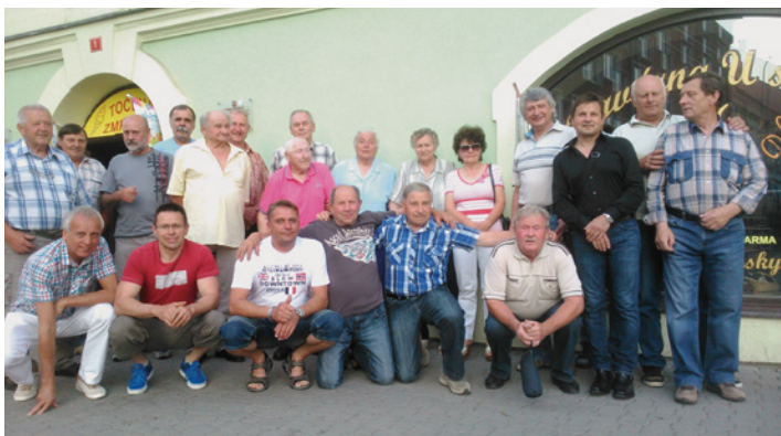
V sobotu 16. června 2015 se uskutečnil sraz bývalých zaměstnanců původního milevského autoservisu, který ukončil svoji činnost v roce 1990.