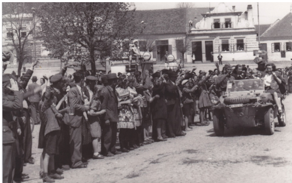
Rudoarmějci v ukořistěném německém obojživelném vozidle Schwimmwagen na milevském náměstí.