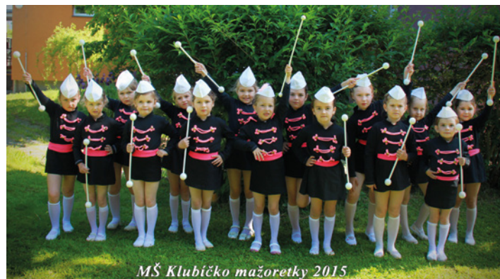
MŠ Klubičko mažoretky 2015