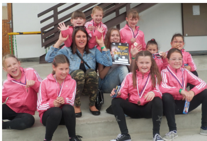
Nejmenší tanečnice z Taneční skupiny EFK se na konci května zúčastnily soutěže v Berouně, na které si vytančily třetí místo.