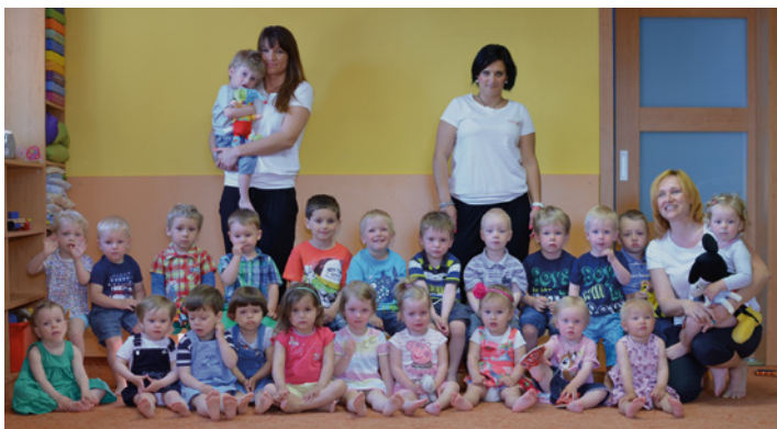
Ve čtvrtek 4. června se konalo v jesličkách Milisek kolektivní focení dětiček na závěr školního roku 2014/15. Pro některé děti to bylo focení v jesličkách poslední, ostatní děti s námi nadále zůstávají a od září se již těšíme na nové „capartíky“.