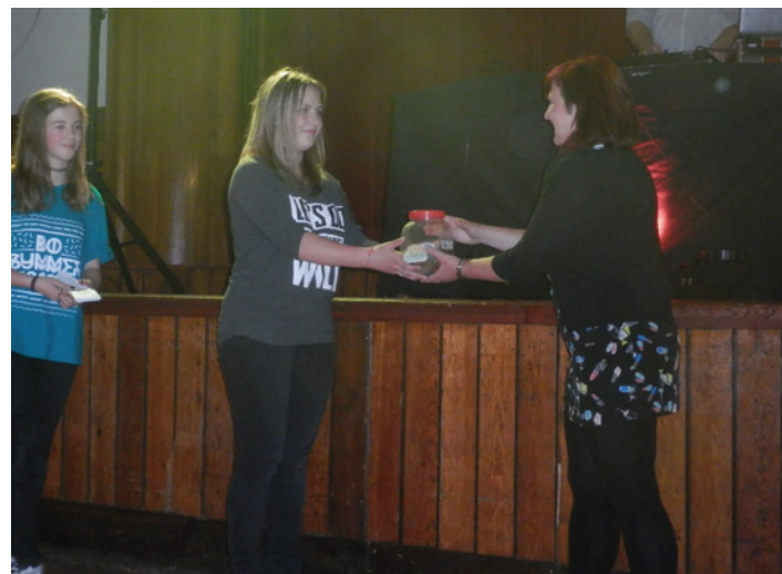
Při taneční show, na které se v milevském domě kultury představily taneční skupiny z Milevska a jejich hosté, návštěvníci viděli nejen tance, ale i aerobik či gymnastické vystoupení. Na dobrovolném vstupném, které bylo v závěru odpoledne předáno zástupkyni milevské charity, se vybralo 4531 korun, které budou použity ve prospěch nízkoprahového zařízení Fanouš.