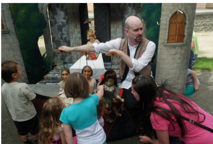
Pražské Divadlo Elf ztvárnilo pohádku ke dni dětí. Představení s velkými loutkami se dětem velmi líbilo a v závěru si mohly i samy vyzkoušet, jak se loutky vodí.