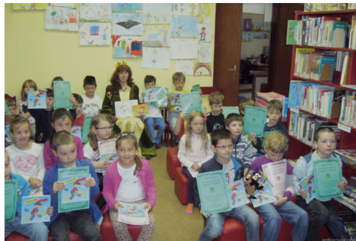
Prvňáčci z 1. ZŠ byli 9. 6. pasováni na rytíře Řádu čtenářského. Všichni dokázali, že si s písmenky už poradí a za to si domů odnesli pasovací dekret a knížku, která bylo napsána a vytištěna pouze pro letošní prvňáčky.