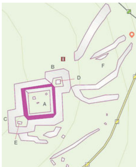
Obr. 1: Plánek Volarských šancí. A - reduta; B-C - dělostřelecké bastiony; D-E - pozůstatky sklípků na municii; F - spojovací příkopy (podle Kuna a kol. 2015).

V minulém čísle jste si mohli přečíst o historických událostech, které dnes označujeme jako začátek evropského válečného konfliktu – třicetileté války. Na následujících řádcích bych ráda představila toto období pohledem archeologie.