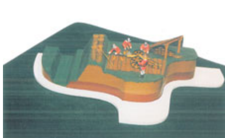
Obr. 2: Model Volarských šancí z Prachatického muzea.

Archeologické výzkumy zaměřené na vojenské události třicetileté války lze rozdělit na dvě skupiny. Jsou to výzkumy pohřebišť a bojišť. Při zkoumání hromadných hrobů na bojištích můžeme díky antropologickým a forenzním metodám identifikovat například různá zranění a čím byla způsobena. Zatímco v Němec-