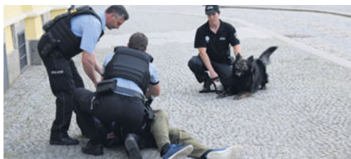
Náměstí E. Beneše se ve čtvrtek 10. května stalo dějištěm Veřejného součinnostního cvičení mladých záchranářů a jednotek integrovaného záchranného systému.