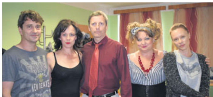
V divadelním představení Miláček Anna excelovali v úterý 22. dubna v Domě kultury v Milevsku zleva Saša Rašilov, Petra Špalková, David Prachař, Martina Hudečková a Linda Rybová.