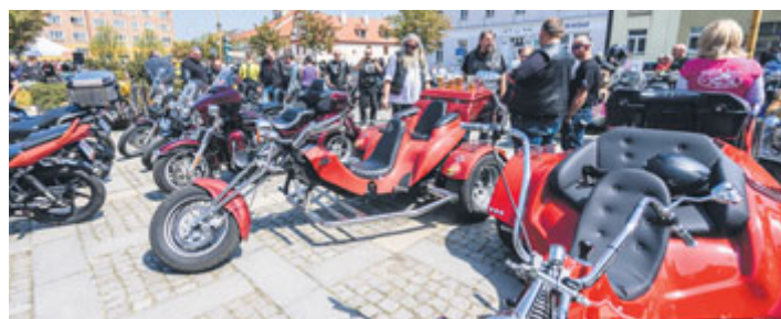
V sobotu 5. května se na milevské náměstí sjelo na 1200 motokářů, aby se zde zúčastnili akce Setkání motokářů s požehnáním na cestu, které se v Milevsku konalo již po jedenácté. V kostele sv. Bartoloměje proběhla modlitba, poté na náměstí žehnání motorek a společná vyjízdka na Zvíkov.