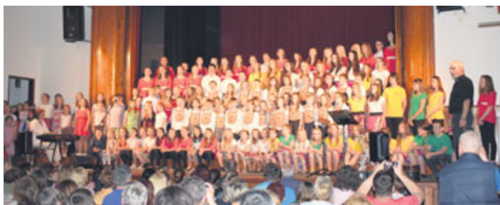
Čtvrtek 10. května patřil DK Milevsko již 42. ročníku koncertu dětských pěveckých sborů. Vystupovaly zde sbory obou milevských základních škol, Milevský dětský sbor a jako host sbor Brumlíci z Českého Krumlova.