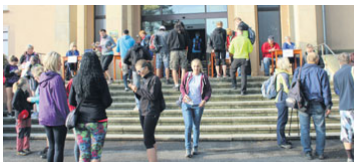
V sobotu 19. května startoval od milevského domu kultury 53. ročník pochodu Praha-Prčice. Na trasu dlouhou 31 km se vydalo 1578 pochodníků a na 40 km trasu 118. 220 cyklistů absolvovalo trasu na kole.