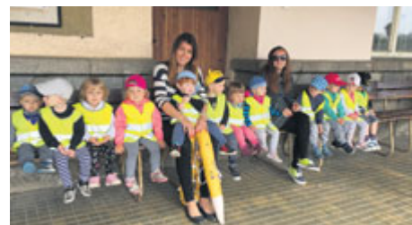
Jesličky a mikrojesle Milísek navštívili společně milevské vlakové nádraží.

Byt dobrým rodičem je náročné a žádná škola Vás na realitu plnou nástrah nepřipraví dokonale. Proto již pátým rokem se nám podařilo získat finanční podporu/dotaci z Ministerstva práce a sociálních věcí na provoz bezplatné Rodičovské poradny pro celý region Milevska, a to v rámci projektu „Klíče pro rodinu 2018“. Cílem této poradny je aktivně a preventivně pomoci s prvními problémy, které nedovolují rodině normálně fungovat. Zároveň chceme posílit sebevědomí, znalosti, dovednosti a orientaci celé rodiny v běžném životě.