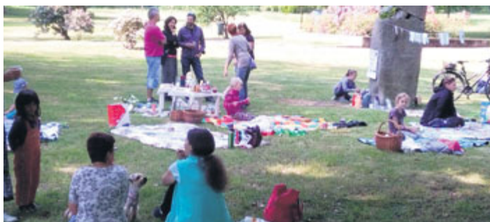
Férová snídaně proběhla 12. května také v Milevsku. Snídalo se v Bažantnici a protože se akce moc povedla, po celé léto se bude v Milevsku nadále „sousedsky“ snídat. Zájemci sledujte Facebook knihovny.