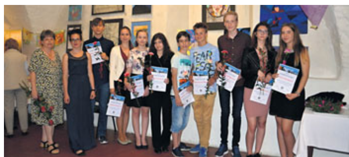
Ve čtvrtek 10. května na vernisáži výstavy výtvarného oboru ZUŠ v Galerii M ředitel školy předal absolventům pamětní listy.