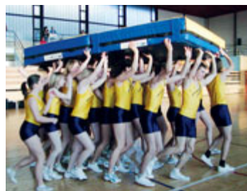
Starší žactvo - 2006.