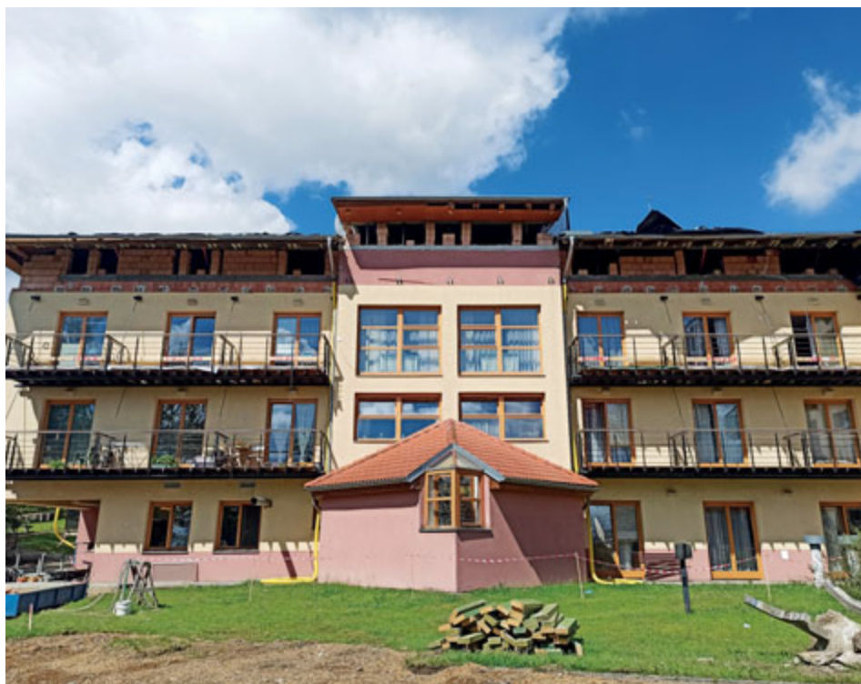
Stavební práce na přístavbě Domova pro seniory jsou v plném proudu. V polovině května začal proces zvedání střechy. Samotné zvedání je prováděno za pomoci heverů, kdy se celá střecha zvedá zhruba po 10 cm a postupně se podezdívá.