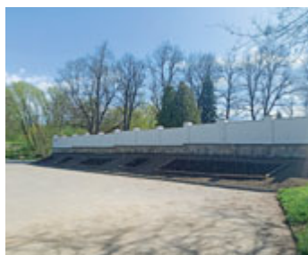
V uplynulých dnech proběhla rekonstrukce hřbitovní zdi. Na fotografiích vidíte stav před rokem a stav současný. Svah před zdí byl osázen trvalejšími záhony.