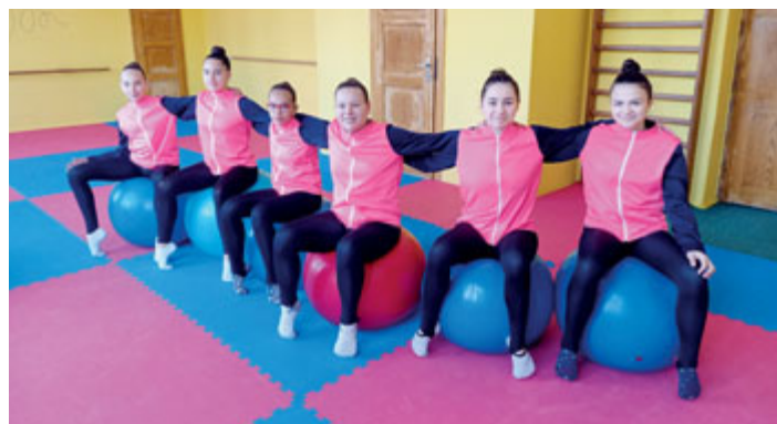
Od dubna se opět vrátily k pravidelným tréninkům moderní gymnastky milevského Sokola. Starší závodní skupina se z pověření Českého svazu estetické skupinové gymnastiky rovnou vrhla na nácvik společné skladby, se kterou se na konci května a v průběhu června zúčastní mezinárodních on-line soutěží.