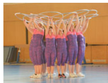
Ženy - 2018.