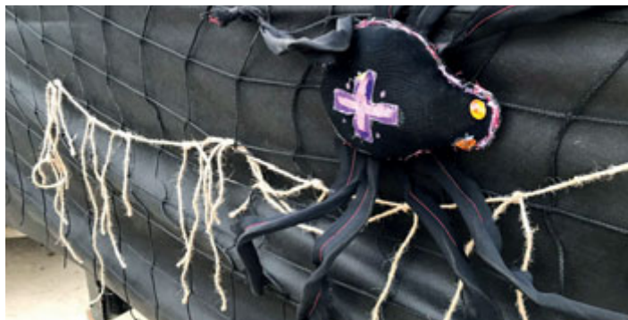
Nechyběla ani jedinečná výzdoba.