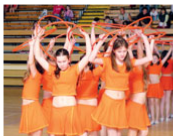
Mladší žákyně - 2006.