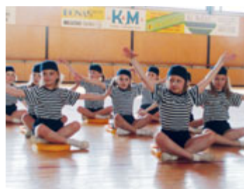
Předškolní žákyně - 2006.