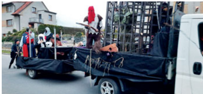
Na závěr trasy projel vůz Blechovou ulicí.