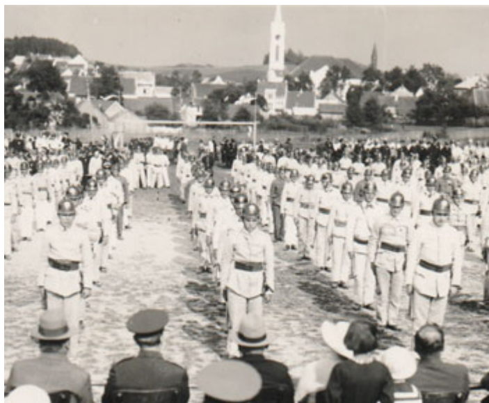
Na snímku je zachyceno veřejné cvičení hasičů na Tržišti v Milevsku v době hasičského sjezdu, konaného zde v červnu 1934.

Milevské muzeum zve všechny milovníky hasičské historie na výstavu ke 150. výročí založení Sboru dobrovolných hasičů v Milevsku s názvem Lidé sv. Floriána.