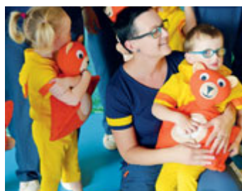
Rodiče a děti - 2018.