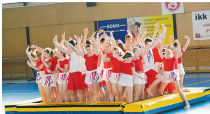
Starší žactvo - 2018.