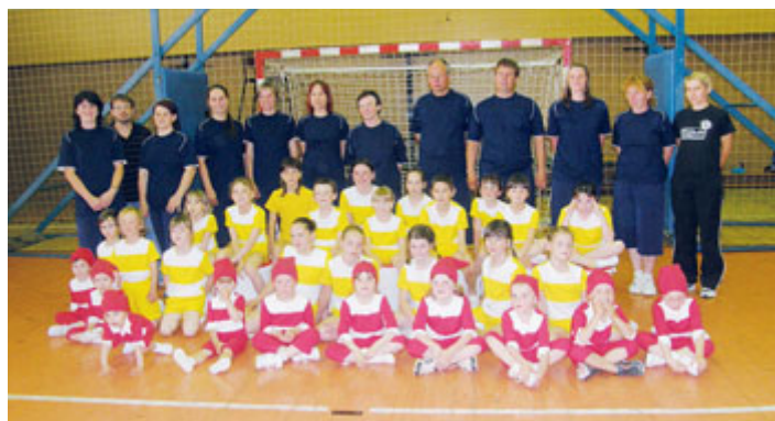
Rodiče a děti + předškolní žákyně - 2012.