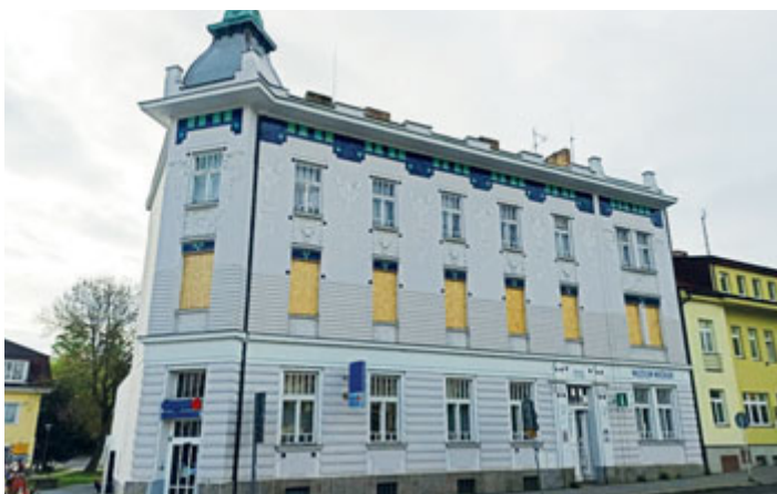
Na historické secesní budově spořitelny začaly práce na restaurování dřevěných oken. Celkem projde rekonstrukcí všech 42 ks oken.