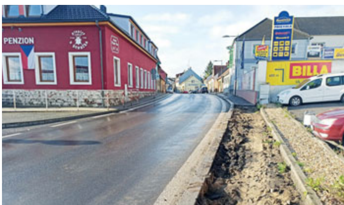
V lokalitě „U Broučka“ začaly práce na výstavbě přechodu pro chodce. Prosíme řidiče o zvýšenou opatrnost v tomto místě.