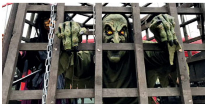
Uvězněná čarodějnice děsila i dospělé.