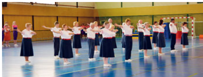
Senioři a seniorky - 2018.