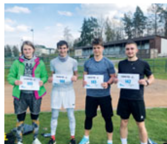
Saxana Run 2021, závod SOŠ a SOU Milevsko, byl už podruhé koncipován virtuálně, obohatil startovní kategorie o chůzi a zaznamenal masový nárůst sportovců - společnými silami bylo zdoláno 900 km.