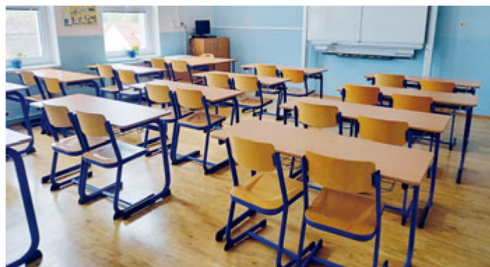
Ve třídách už je zase rušno. Po dlouhých měsících distanční výuky se mohli koncem května vrátit do školních lavic i středoškoláci. V několika třídách milevského gymnázia byly v době distanční výuky vyměněny školní lavice, skříně a regály, a tak byl návrat do školních lavic provázen vůní nového nábytku.