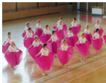
Ženy - 2006.