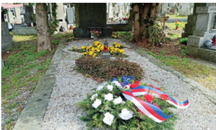
V sobotu 8. května jsme si připomněli 76. výročí od konce 2. světové války. V Milevsku proběhlo uctění památky položením věnců.