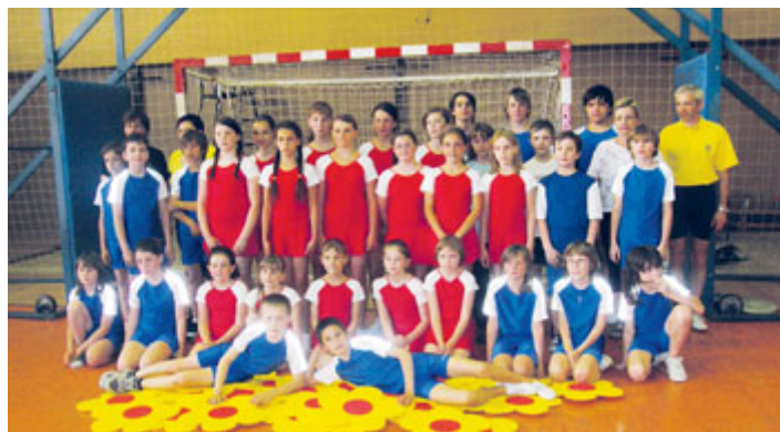
Mladší žactvo - 2012.