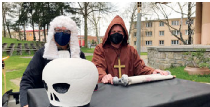
Soudce a mnich připraveni na startu.