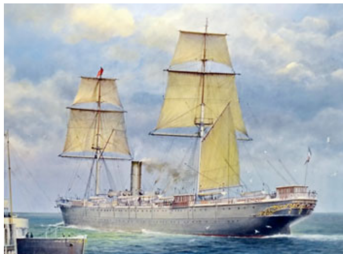
Loď Cimbria na dobovém vyobrazení.

Zatímco Sultán i celá jeho posádka včetně dvanácti cestujících se dostala do bezpečí, pro Cimbrii už nebylo záchrany. Její poškození bylo příliš velké. Loď se posléze naklonila na bok,