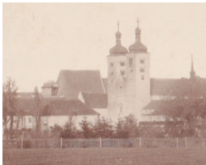
Milevský klášter s původními barokními báněmi na věžích. Cibulovité báně zde byly od roku 1712 do dubna 1897, kdy byly sňaty. Snímek ze sbírek Milevského muzea.