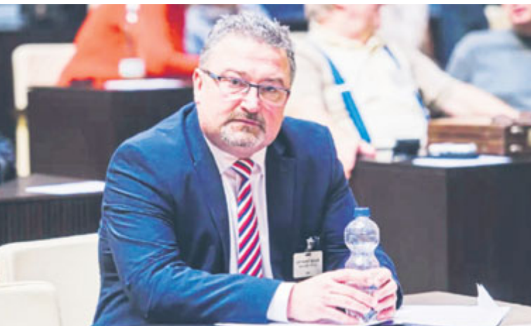
Ing. Petr Král z ČNB na půdě Ústavního soudu.

Na úterý 9. dubna od 17:30 hodin přichystala produkce milevského DK besedu s ne zcela typickou tematikou. O inflaci, čili růstu cen, boji ČNB proti ní a vůbec o současném ekonomickém „životě k nezaplacení“ v naší republice přijede do zdejšího loutkového sálu povypprávět renomovaný ekonom Petr Král (50). Ten zastává pozici ředitele měnové sekce v pražském ústředí České národní banky (ČNB). A právě k zásahům této národohospodářské instituce vůči donedávna vysokému tempu znehodnocování peněz, a potažmo i úspor lidí, by měla přijít řeč především. Při svém podzímním vystoupení na podobné téma v Blatském muzeu v Soběslavi na toto konto mimo jiné padla následující slova: „Na zdejší poměry byla inflace poměrně dlouho přímo ob-